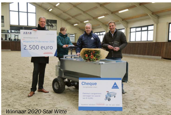
Winnaar 2020 Stal Witte

Tijdens De Hippische Ondernemer Dag op de KWPN Stallion Show op donderdag 3 februari (meer hierover op pagina 26) wordt de winnaar van deze verkiezing 'Hippische Ondernemer van het Jaar 2021' bekend gemaakt. Van de genomineerde bedrijven (De Lindenhoeve in Emst, De Hultenhoek in Groeningen en MT Stables in Kootwijkerbroek) wordt de winnaar gehuldigd met de eervolle titel en daarnaast mooie prijzen.