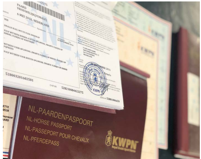
Een derde van de paardenstapel is geregistreerd, er moet nog veel gebeuren.

Ter Horst: "De wettelijk verplichte registratie van paardachtigen is inmiddels op gang gekomen. Houders ervan moeten voor het einde van het jaar 2021 bij de Rijksdienst voor Ondernemend Nederland (RVO) een Uniek Bedrijfsnummer (UBN) aanvragen. Op 20 september 2021 waren 27.173 UBN's aangemeld (van de te verwachten 82.600). Het aantal aangemelde paarden bedroeg 140.658 (van de te verwachten 449.950). Grosso modo is dus van een derde van de paardenstapel de verblijfplaats bekend. Er is dus werk aan de winkel! Er zal volgend jaar gehandhaafd gaan worden. De vraag is: hoe krijgen we de sector zo ver, dat iedereen zich laat registreren? Daar wordt aan gewerkt en ik draag langs deze weg een steentje bij."