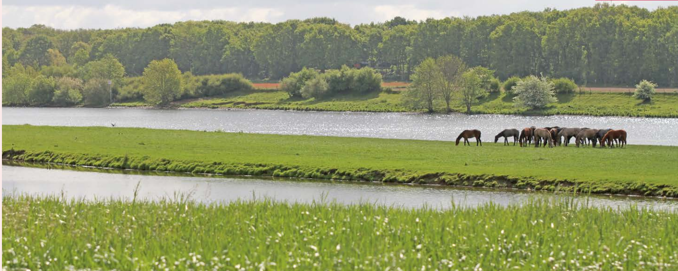
Jaarlijks komen er bij HX Breeding ruim 80 veulens bij. Deze worden opgefokt op hun weilanden in Kessel, gelegen aan de Maas.